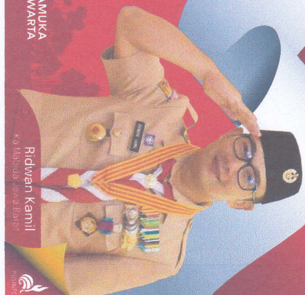
Ridwan Kamil Ka Mahkota, Jawa Barat